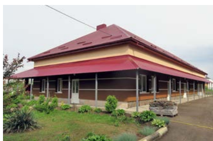
Майстерні, відділення раннього втручання, зал