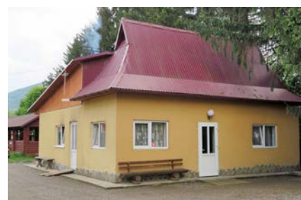
Виставкове приміщення та котельня